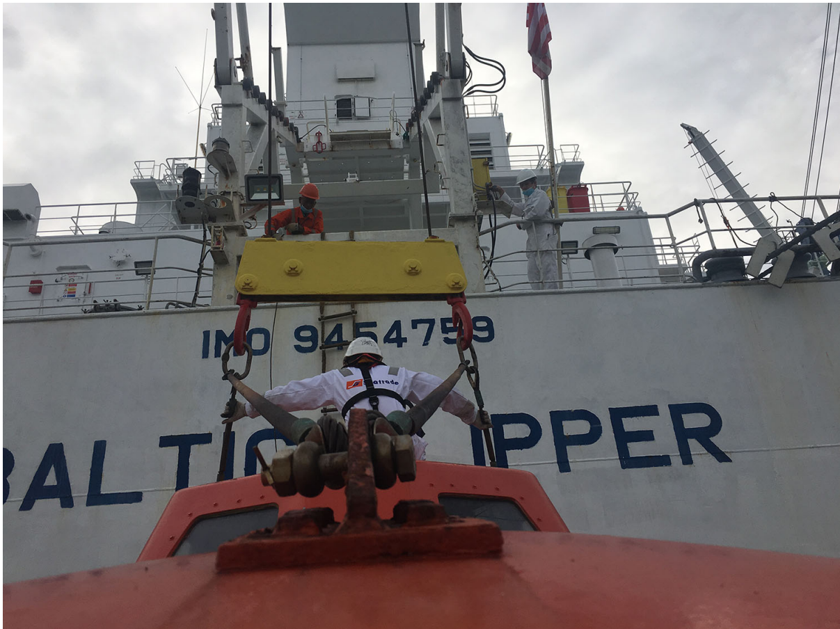
安全第一：在 Baltic Klipper 輪上工作。